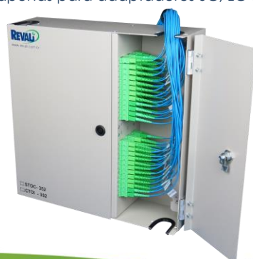
Simulação da saída com cordões ópticos de Ø2mm

* Capacidade de 72 fibras apenas para adaptadores SC, LC ou E2000.