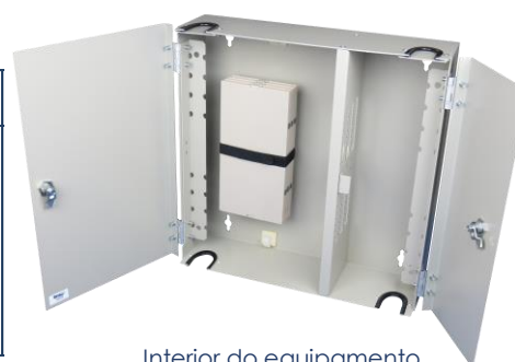
Interior do equipamento

* Capacidade de 72 fibras apenas para adaptadores SC, LC ou E2000.