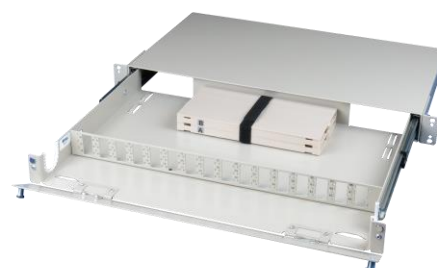
Interior do equipamento

Sub-bastidor equipado (DGO): 9101e-Cg.hijk.lmn