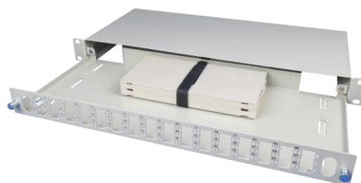
Interior do equipamento

* Capacidade de 48 fibras apenas para adaptadores SC, LC ou E2000.