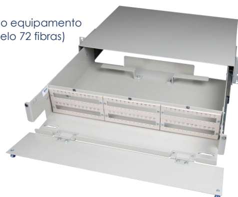
Interior do equipamento (modelo 72 fibras)

Sub-bastidor equipado (DIO): 9102e-Kg.hi0A.lmn